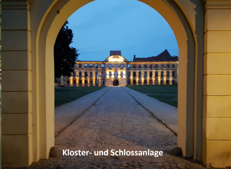
Kloster- und Schlossanlage