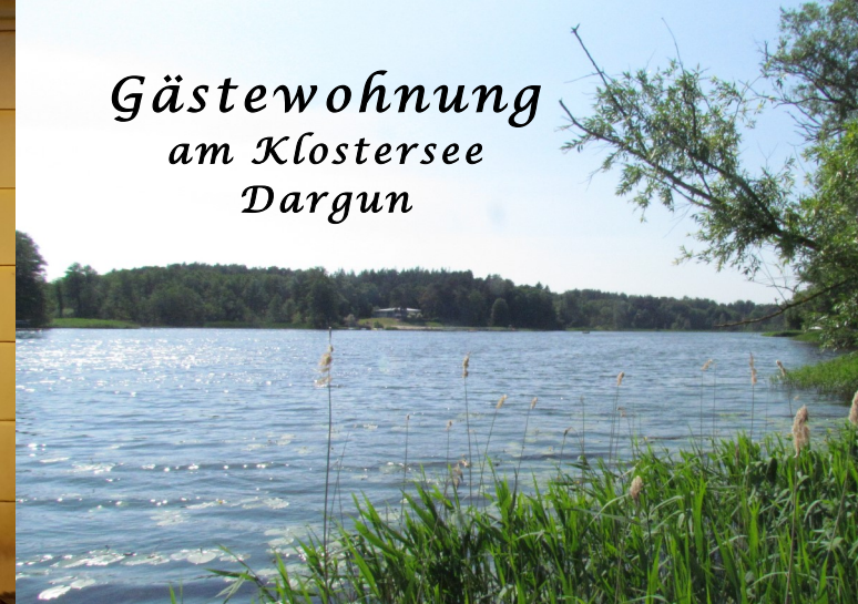
Gästewohnung am Klostersee Dargun