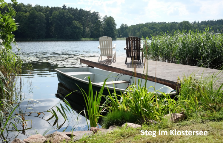
Steg im Klostersee