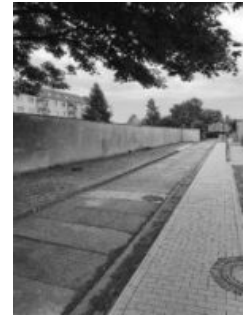
Die Mauer vorher > und die Mauer hinterher

Im Namen der Kita, des Elternrates und der Kinder, Frau Schulz und Frau Schröder